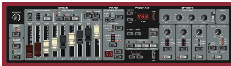
Nord Electro 4D