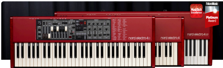
NORD Electro 4D, 4 sw73 e HP da NORD

O Nord Electro 4 da NORD conta com 3 modelos: o modelo Nord Electro 4D possui drawbars físicos do mesmo tipo do aclamado Nord C2D, perfeito para modelagem sonora ao vivo, já as versões Nord Electro 4 SW73 e HP em suas seções de órgão contam com as mesmas características porém possuem drawbars digitais em LED.