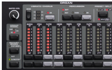
Drawbars digitais dos modelos 4 e HP

Todos os modelos NORD Electro 4 tem funcionamento semelhante exceto no modelo 4D conforme figura acima onde drawbars deslizantes tomam o lugar dos digitais dos modelos 4 e HP. Quanto ao controle existem basicamente 4 seções: Organ, Piano, Program e Effects. Um knob de controle de volume no lado esquerdo superior controla a saída de volume do fone de ouvido e das saídas estéreo do teclado (RIGHT OUT e LEFT OUT).